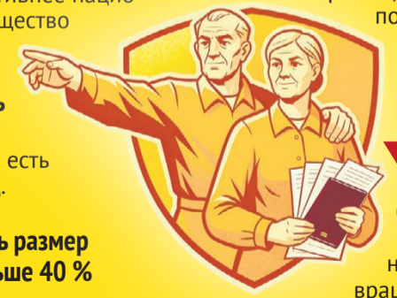
Иллюстрация: Алексей Беленев

В общем, доверять ли государству, решать по-прежнему каждый сам за себя. Но, выбирая конкретный пенсионный фонд, лучше, конечно, семь раз проверить и лишь потом один – доверять.