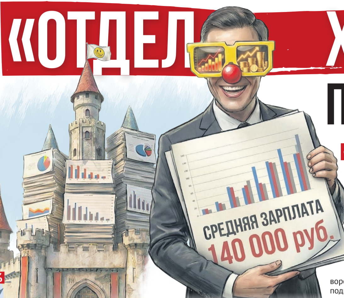
Иллюстрация: Алексей Беленев