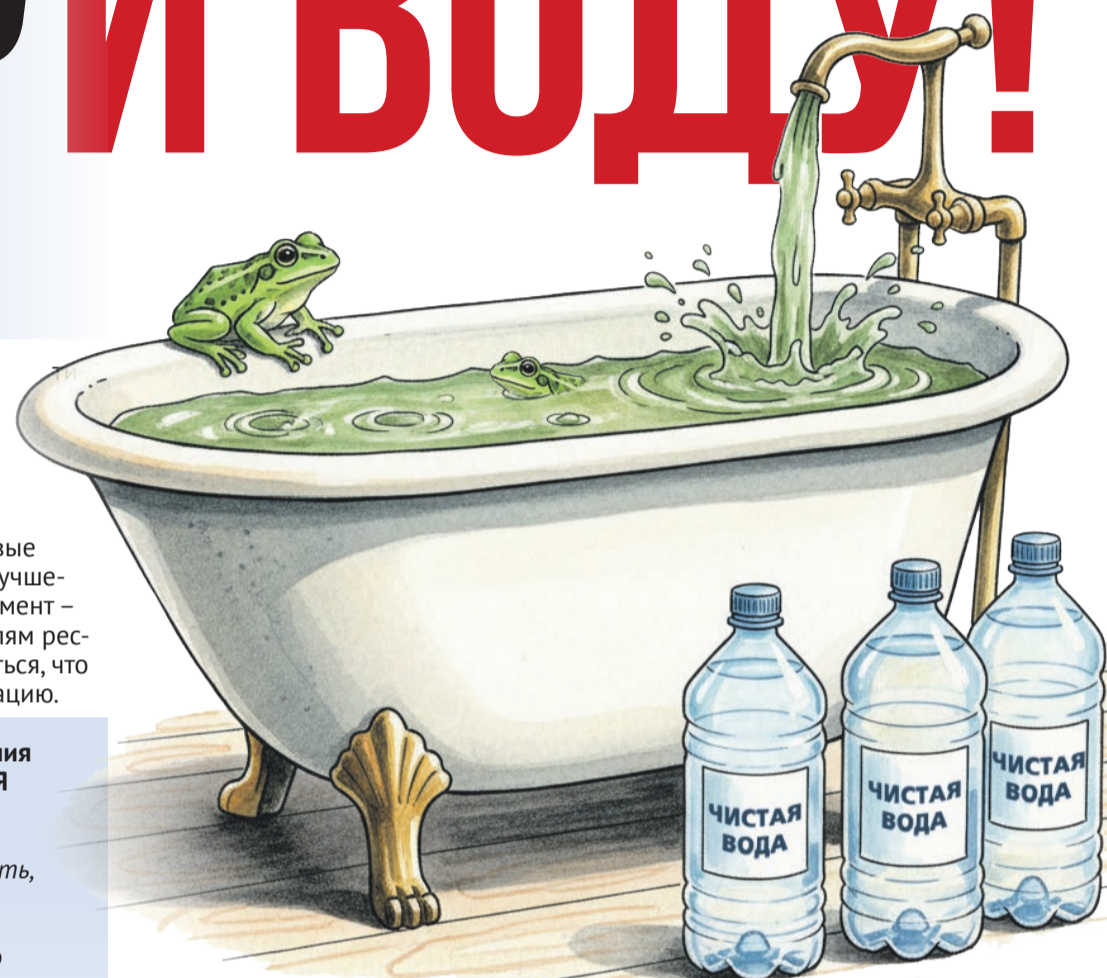
Иллюстрация: Елена Миронова

Небывалое наводнение в Дагестане с новой силой вынесло на поверхность еще одну проблему. Когда из наших кранов будет течь кристально чистая, почти родниковая вода? Разобрались в нашем материале.